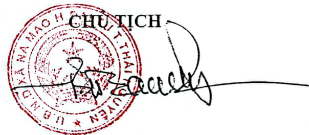
Bé Văn San